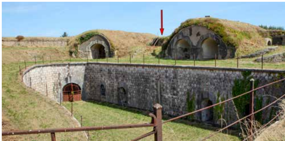
Situación teórica aproximada del observatorio.