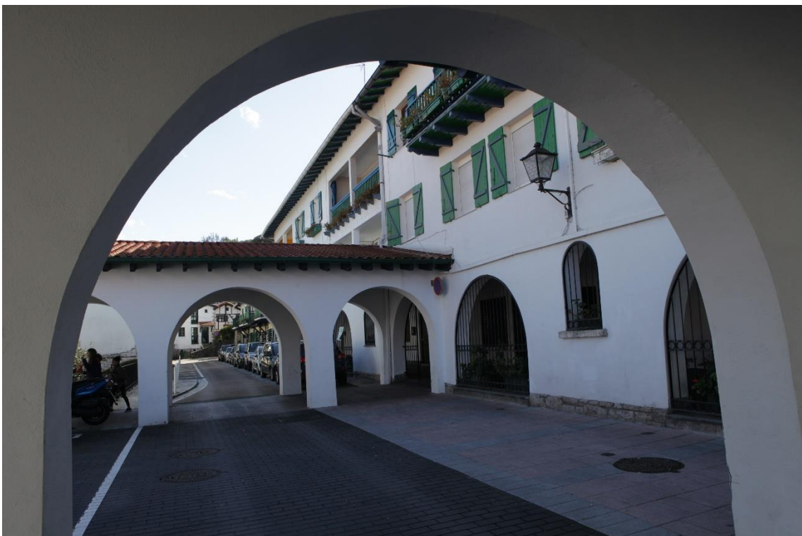
5 Interior de la arquería. A la derecha, el edificio 3 con su aporte de dos arcos y un vano menor la arquería de acceso. Inicialmente solo el arco de la derecha de la fotografía estaba habilitado para la circulación de vehículos. El resto estaba diseñado como un jardín.