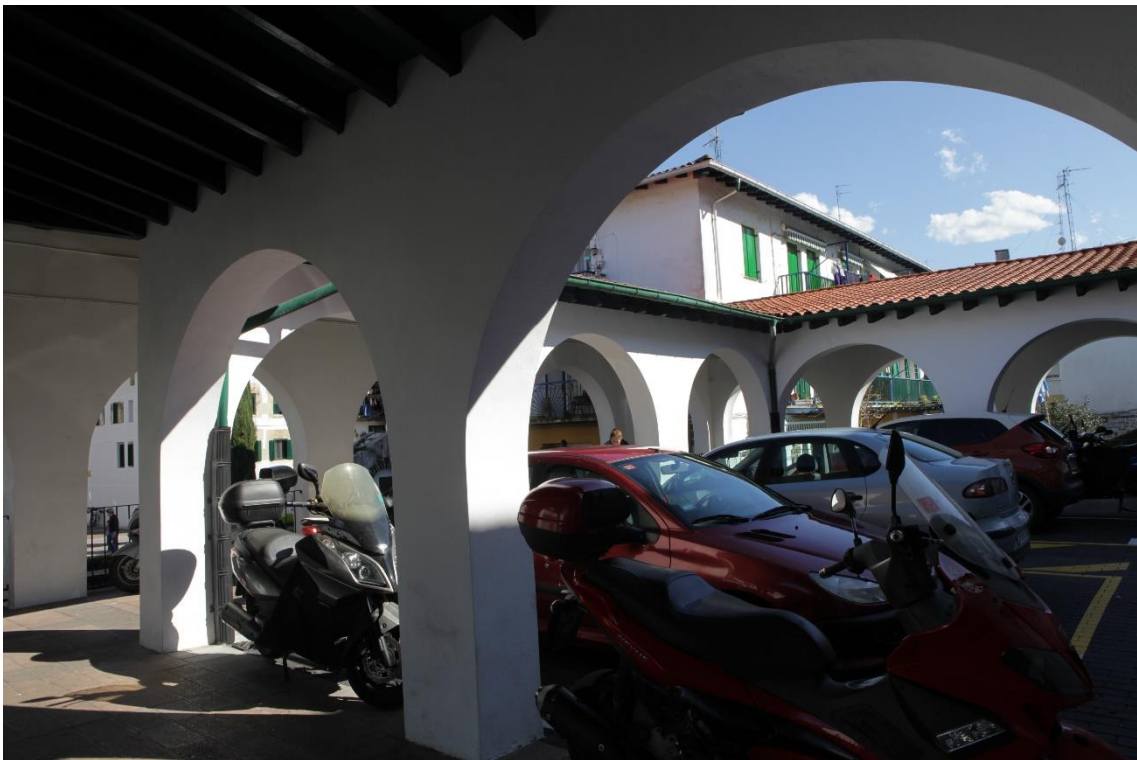
7 Vista de la arquería, con su interior mayoritariamente destinado al aparcamiento y circulación de vehículos.