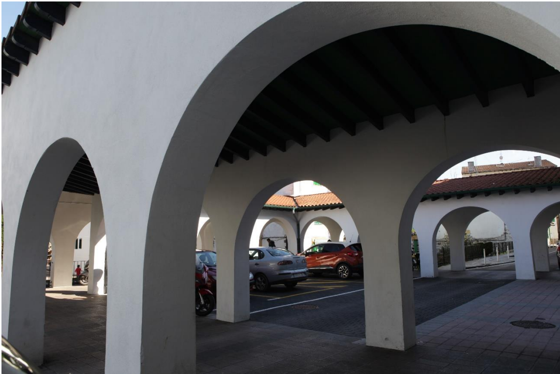
4 Interior de la arquería de acceso.