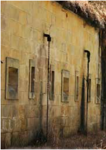
Galería de Escarpa. Exterior coincidente con la zona del cuartel de infantería (5).