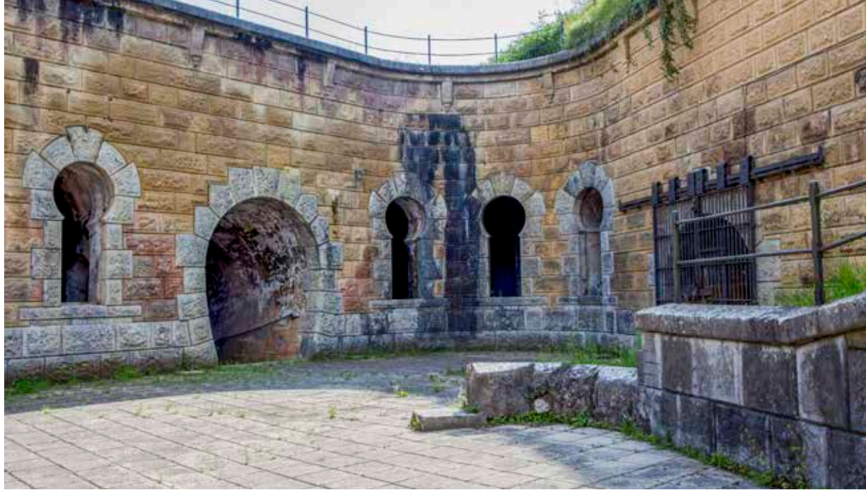
Patio principal o “de armas”. Comparando con la fotografía de la izquierda (año 1900) se aprecian diferencias en el piso, falta de aceras, farola y carpintería de ventanas. Por el contrario la boca de una poterna incorpora un rastrillo que dada posiblemente de 1934.