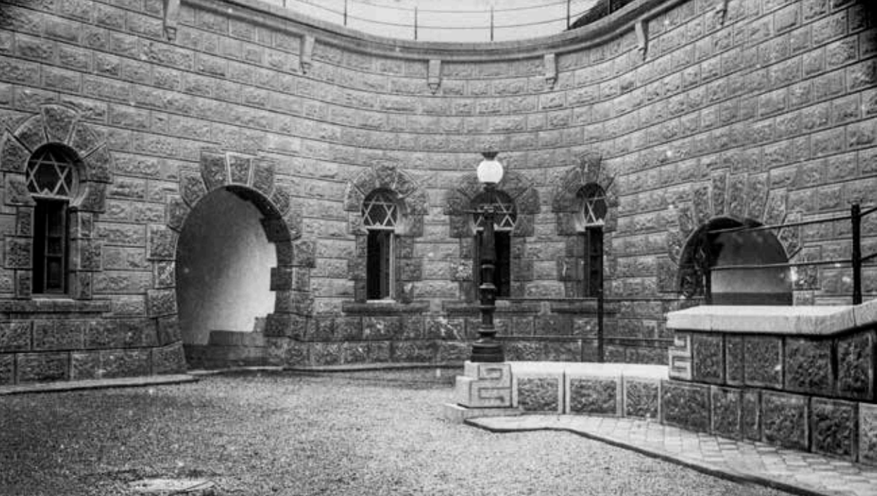
Patio principal en el año 1900.