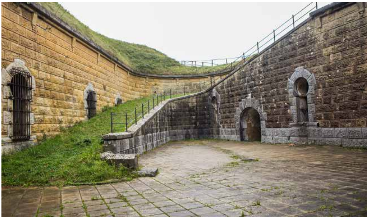
Patio principal o “de armas” visto desde el acceso principal.