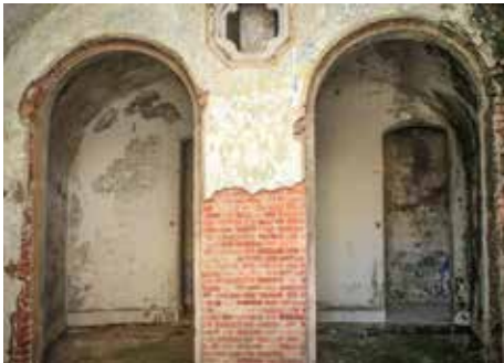
Pabellones de oficiales de Infantería. La fotografía está obtenida desde el sector común (2) de dos de los aposentos. Se observan los dos habitáculos, con entrada independiente (al fondo de la fotografía) desde el pasillo de servicio, así como un respiradero cruciforme. La configuración de espacios en el interior del recinto abovedado se realiza mediante tabique de ladrillo. Actualmente se conservan los tabiques de división, pero no así el suelo, originalmente constituido por un entarimado.