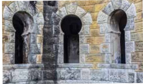
Fachada exterior, al patio de armas, de los pabellones de oficiales de Infantería. Llamamos la atención los arcos de aspecto árabe.