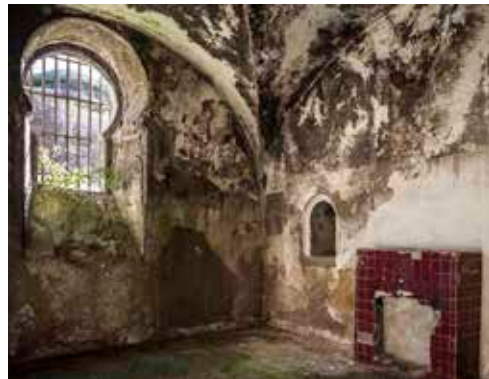
Comedor y sala de estar (5) de los oficiales de Infantería. Se aprecia la chimenea, alicatada con azulejos de color granate y a su izquierda la ventanilla de comunicación con la cocina, situada en la estancia contigua. A la izquierda una de las ventanas de aspecto árabe que caracterizan al patio de armas del Fuerte.