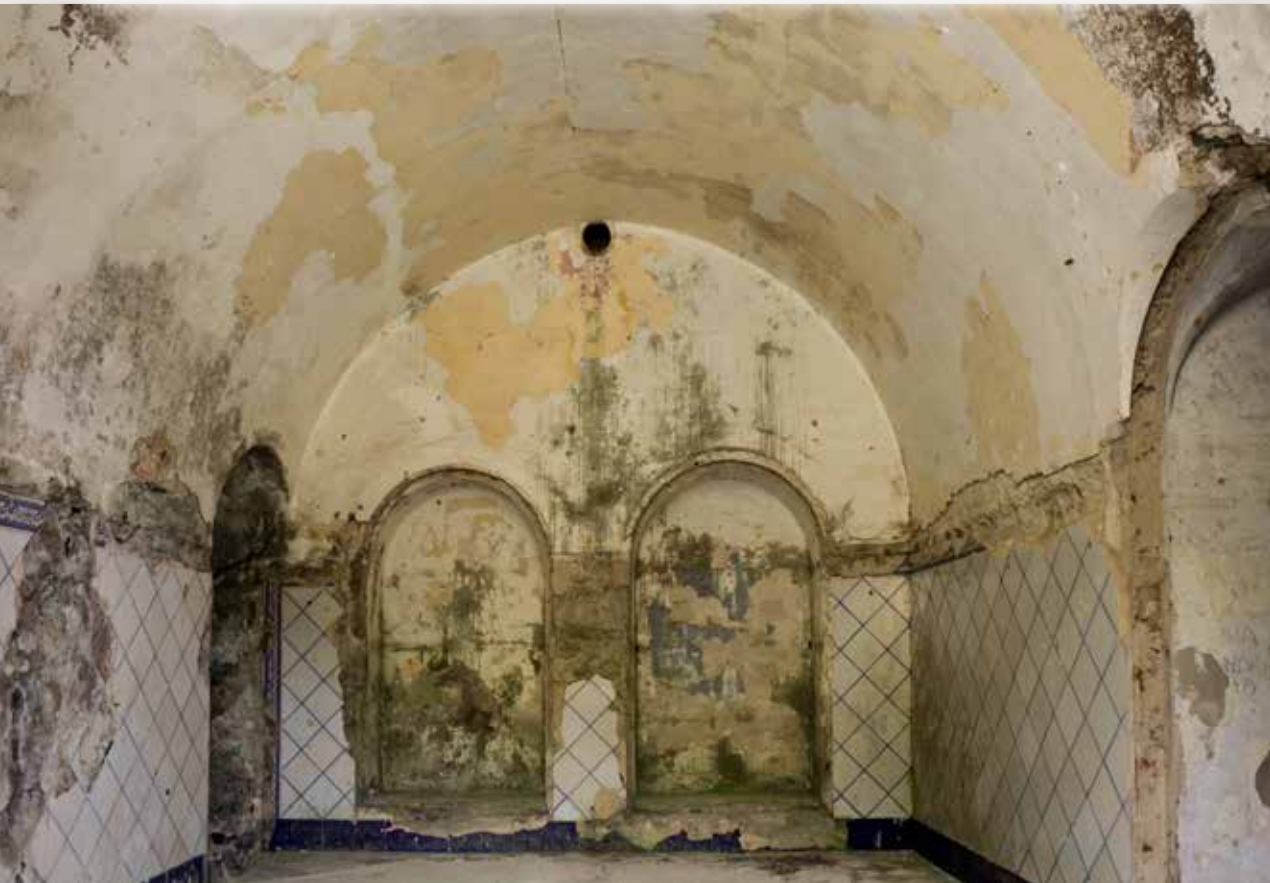
Cocina. Se aprecian las dos hornacinas con estantería y a la derecha la comunicación con el comedor.