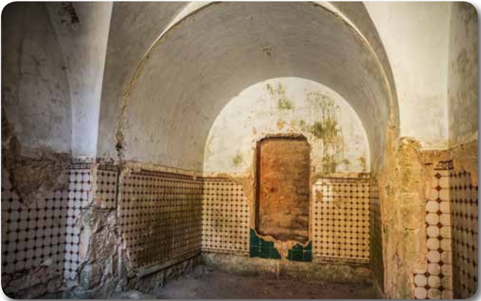
Comedor. Al fondo, la alcoba para dos camas y una hornacina a modo de armario.