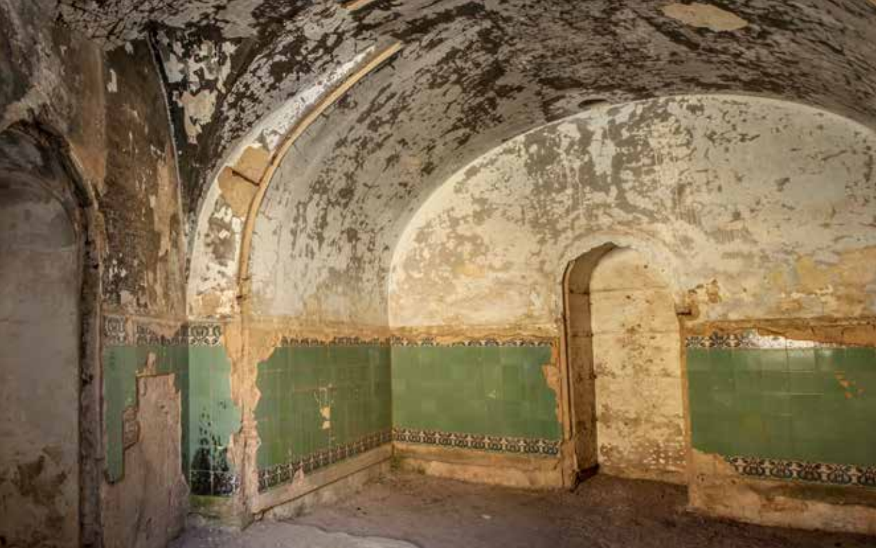
Salón alicatado con baldosas de color verde y cenefas decoradas. A la derecha, la alcoba.