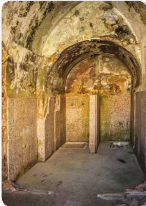
Vestíbulo y WC del Pabellón del Gobernador. Estado actual reformado en los años 60, incorporando ducha y wc turco para el pequeño destacamento de custodia..