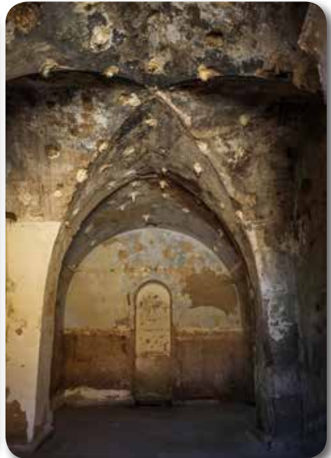
Despacho, alterado hacia 1970. Al fondo, alcoba para dos camas con hornacina con función de armario con estantería para la ropa..