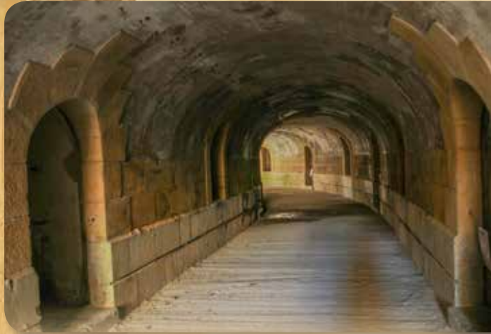
Poterna entre el patio principal y el patio de infantería (2).