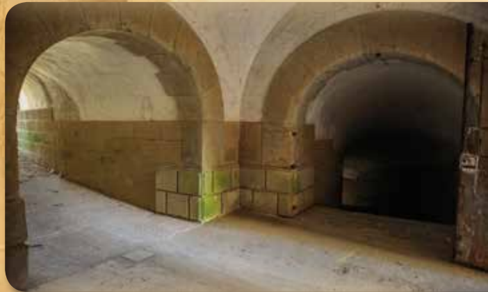
Accesos a las dos poternas que comunican el patio de Infantería y los dos patios de la Obra de la Derecha.(5 y 6).