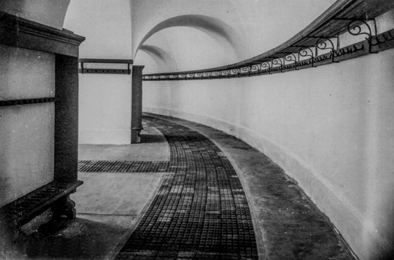
Cuartel de artillería a principios del siglo XX. Se aprecian las tablas de equipo y los armeros. (Juan Roca. © Patrimonio Nacional, Real Biblioteca).