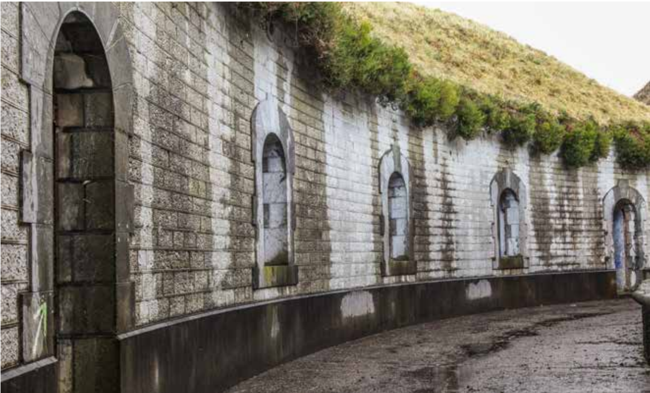
Fot. inferior: fachada del cuartel de Artillería