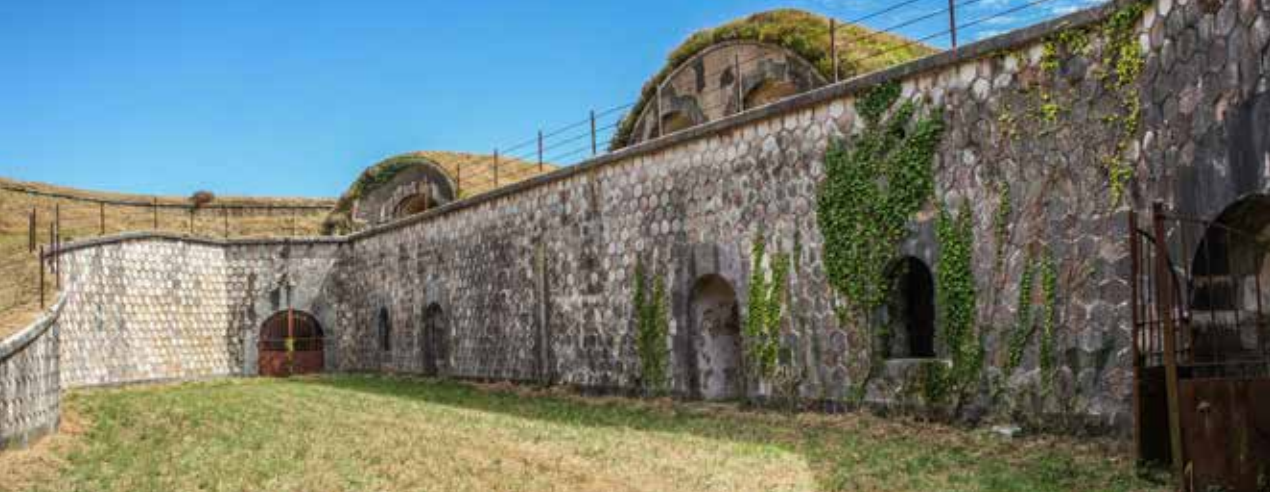
Patio oriental de la Obra de la Derecha visto desde su extremo sur. Se aprecia, a la izquierda, la rampa de acceso a los terraplenes de la Obra. Fot. inferior: vista desde el norte.