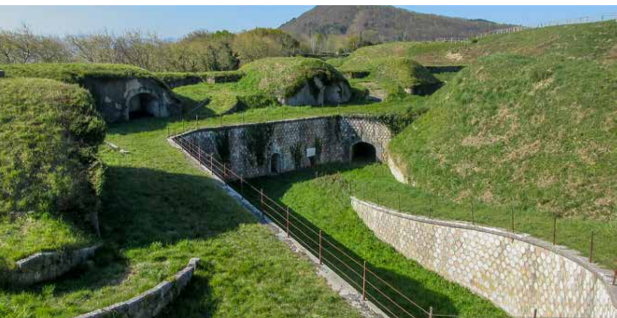
Vista desde el blindaje de un través..