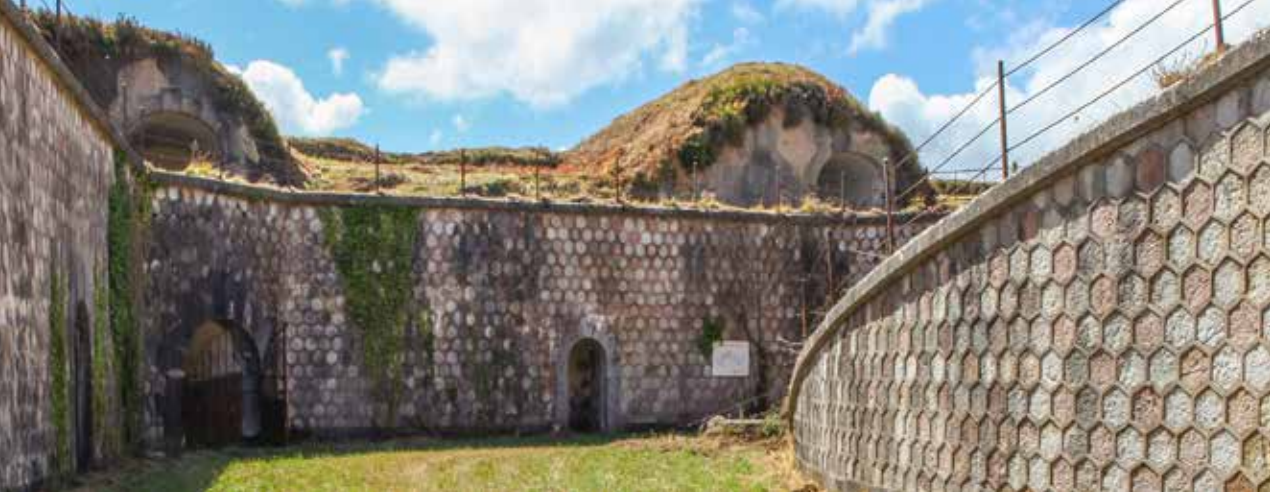
Patio oriental. Comparación entre su estado en los años 2018 (fot. superior) y 1900 (fot. inferior) según la fotografía de Juan Roca. © Patrimonio Nacional. Real Biblioteca.