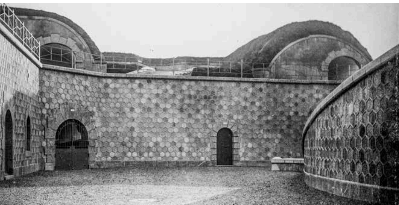
Fot. inferior: vista del patio desde la cubierta del cuartel de artillería. Se aprecian también los terraplenes de servicio y combate, así como los traveses del frente oriental.