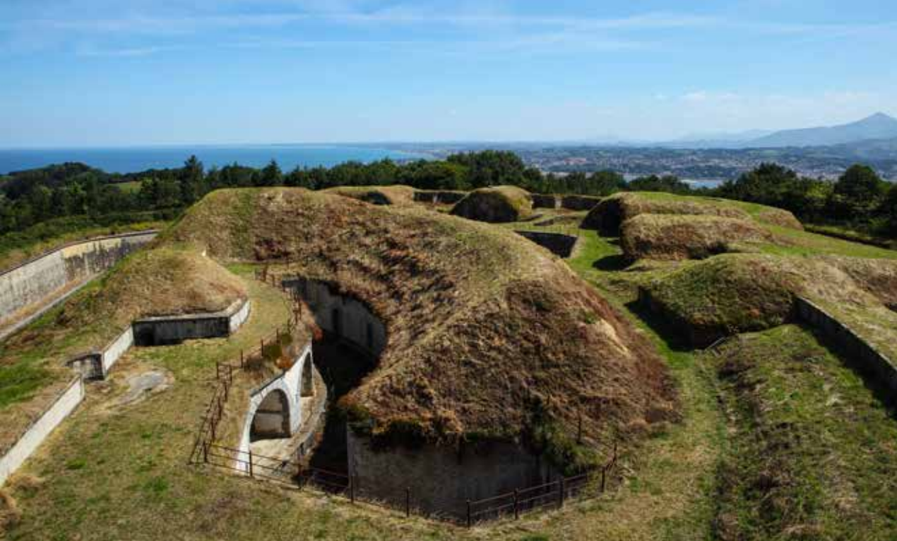
Obra de la Derecha. Fot. superior. vista de oeste a este tomada desde la batería acasamatada. Fot. inferior. vista parcial de este a oeste, tomada desde la máscara continuación del blindaje del cuartel de Artillería.