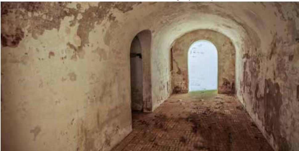
Fot. inferior: cuarto de carga del Depósito distribución de munición de la Obra del Centro (3). A la izquierda, la comunicación con el montacargas y los depósitos.