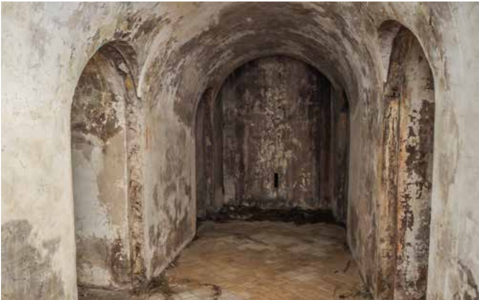
Fot. superior: depósito de distribución de la Obra de la Derecha. Bóveda de comunicación con suelo embaldosado. A izquierda y derecha se aprecian los accesos a los depósitos propiamente dichos y al fondo la caja del montacargas de munición.