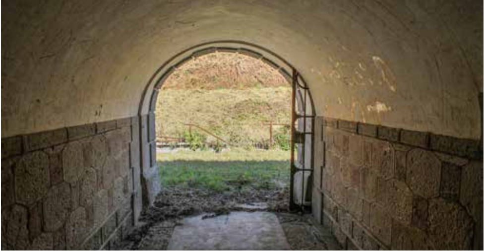
Interior del través central de la Obra del Centro . Se aprecia la reja de dos hojas curvas deslizantes del acceso a la estación superior de montacargas, situado en la posición del fotógrafo.